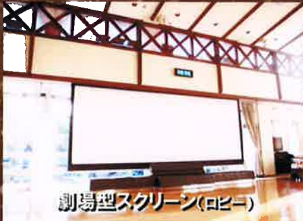
劇場型スクリーン(ロビー)