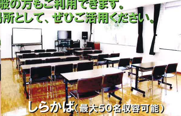
しらかば(最大50名収容可能)