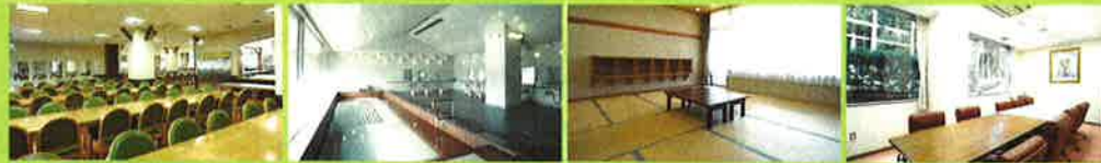
◎食堂 ◎大浴場 ◎宿泊室 ◎会議室からまつ