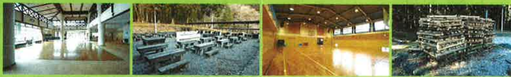
◎ロビー ◎飯ごう炊さん場 ◎体育館 ◎キャンプファイアー場